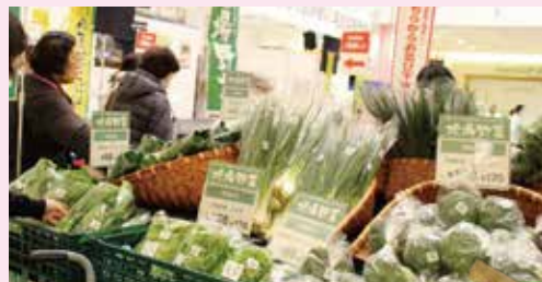
※写真は第2回の会場の様子です。